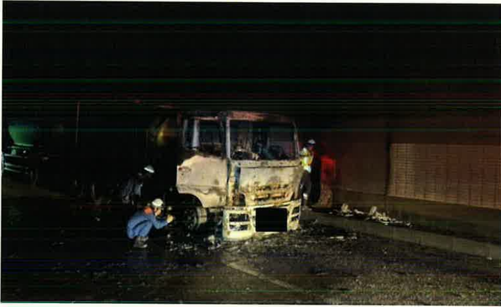
(7/26 14:15 撮影)