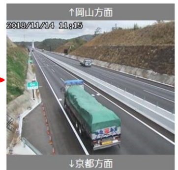
アイハイウェイ 画像イメージ