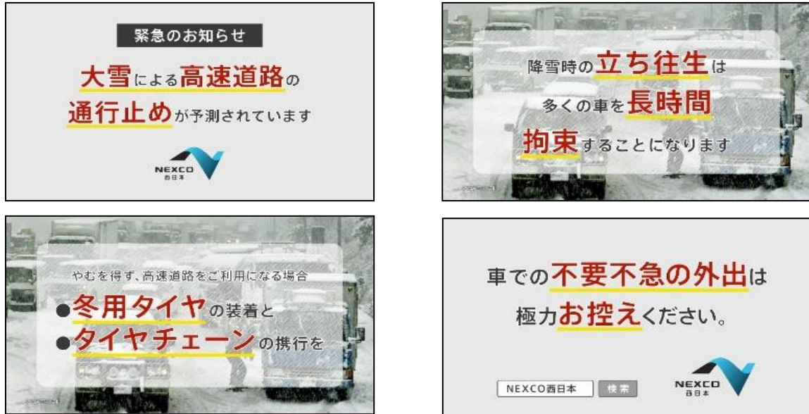
緊急のお知らせイメージ

また、大雪が予測されている場合など、お客さまに車での不要不急の外出をお願いする際は、緊急のお知らせCMによる広報を行います。