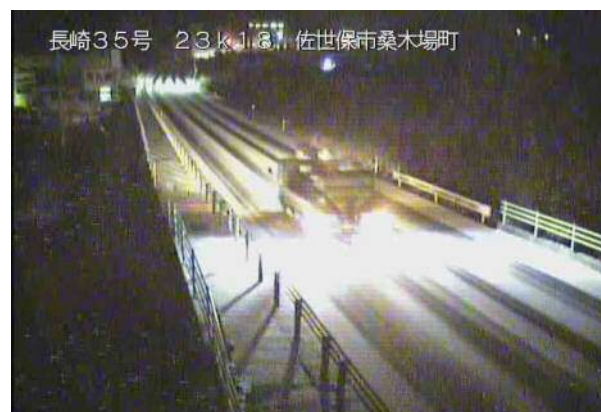
融雪剤散布作業中