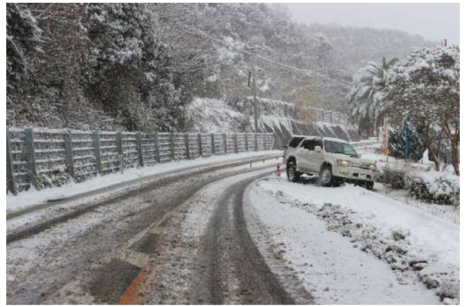
スタック車両の状況 (2016年1月)